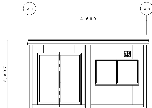
Y 1 立面図 S = 1/50